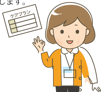
ケアマネージャー

この計画に基づき、地域内の関係機関と連携し、効果的な介護を提供することで、利用者様ができるだけ長く安心して自宅で生活できるよう支援します。