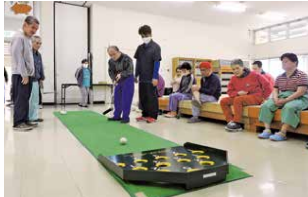
心もスカット!! スカットボール