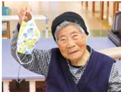
じょ~とう出来たよ~

今では手作りマスクでデイサービスに通われています。今後新型コロナウイルスに負けられないようお互い頑張ってくださいませう。