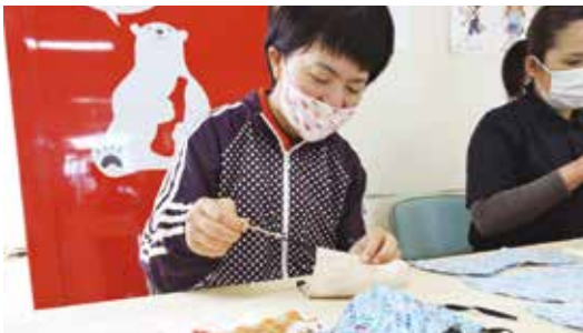
利用者さん・職員の共同作業

三月は新型コロナウイルスの影響でデイサービスも自粛モードがありました。その後は皆さんも元気に利用されています。世間ではマスク着用、手洗い・うがいの推奨をしていますが、肝心のマスクが売ってありません。そこでデイサービスでは、利用者みなさんと手作りマスクを作りました。久々に針と糸を扱っていましたが、コツを覚えるとスイスイと裁縫ができ、素晴らしい一面も見せてくれました。