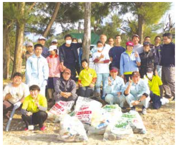
綺麗になりました！