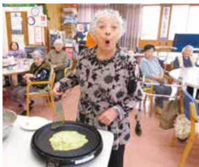
テンション上がってますよ♪楽しい～

今年新型コロナウィルスの影響で三月のつじ見学ができませんでした。そのため、デイサービスでは屋内で楽しもうと、いつものゲームやカラオケではなく、ヒラヤーチーづくりを企画しました。女性陣は手際よくヒラヤーチーを作るのですが、男性陣は焼き加減は職員に教えてもらいながら、頑張ってくれました。普段のおやつは厨房の手作りですが、今回は自分たちで作ったヒラヤーチーを美味しく