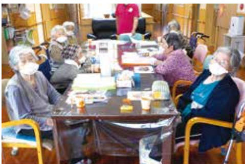
手作りマスクでしっかり予防