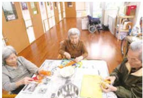
みんなできると「楽しい」

「きじよか」では日曜日の食事を調理担当の職員がメニュー決め料理を作っています。その日はシチューがメイン料理で利用者様にもジャガイモ、ニンジン、タマネギの下処理を皮むき器や包丁を使って手伝っていただきました。男性の利用者様からは「台所に入ったことがなかったから上手くできる気がしない」と自信なさそうでしたが、皮むきを器用に行っていました。出来上がった食事を皆