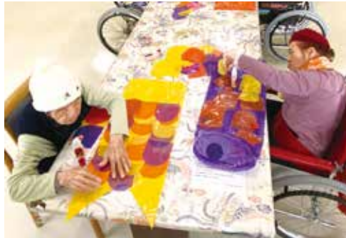
とてもいねいに貼りつけてます

外出自粛を余儀なくされている現状ではありますが、一心療護園では室内レクや創作活動を充実させ、明るく楽しく過ご