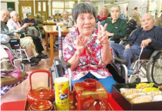
皆さん健康で過ごせますように。 コロナウイルスが早く終息 しますように...