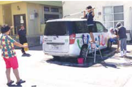
綺麗になりました！

去った三月二十八日、就労センターえすの里では年度の締め括りとしてソフトボールボール大会と慰労会を開催しました。年度三回目のバレー大会となると利用者さんも順位にこだわり負けず嫌いを発揮してとても白熱したリーグ戦になりました。 バレー大会の後は就労センターで慰労会を行い、飲食を楽しみました。また、長年寄り添い共に頑張ってきた職員の送別会も行い、思わず寂しく涙を流す利用者さんもありました。別れがあれば新たな出会いもある。次年度も頑張れ就労センターえすの里！！