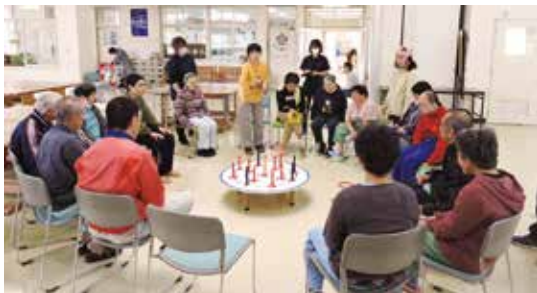
高得点めざして、一投入魂

えすの里では、コロナウィルス予防の為県内、施設外での研修等も延期・中止になり利用者・職員も楽しみにしていた四月の塩屋トリムマラソンも中止。五月の利用者買い物支援も何時になるか目途が立たない状況ですが、利用者様は室内での余暇活動でスカットボールや輪投げ・トランプやかるた遊びを楽しんでいます。ゲームの点数を気にして真剣に取り組む表情が又普段とは違った顔があり自粛を意識せず楽