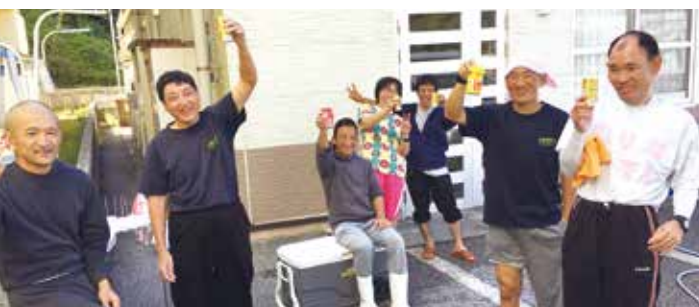
疲れたけど美味しい！

グループホームえすの里では三月二十九日の休日に利用者さん発案のもと就労センター、グループホームで使用している車輛六台の洗車を行いました。 数名の利用者さんから洗車をしたいとの要望を受け、他利用者さんにも声を掛けた所、七名の有志が集まり、各工程に分けて取り組みました。自分たちで相談してノリノリになる音楽をガンガン流し、コロナウイルスの影響で外出が出来ないストレスを解消しながら楽しんで洗車しました。洗車後、充実感に包まれ笑顔で缶コーヒーを乾杯している姿がとても印象的でした。