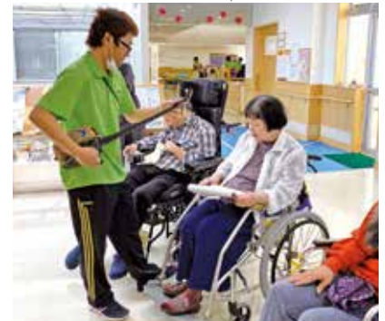
職員による即興民謡ライブ