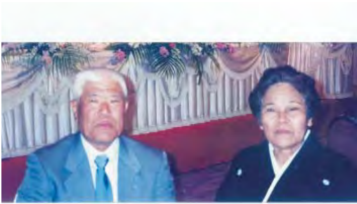
おしどり夫婦でした

人生はたった一度と言われますが、その人の歩んだ人生は唯一のもの。その貴重な体験を「私のヒストリー」（ライフヒストリー）と題してご紹介する企画です。