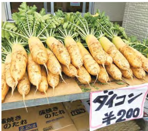
大盛況だった大根

毎年、大宜味村で行われる産業祭りにはえすの里も出店しました。野菜や惣菜、小物などを沢山のお客様に購入して頂き、特に大根や惣菜等は早めに完売になる状況でした。 来年もお客様が笑顔になる様な良い品を提供出来る様に頑張ります。