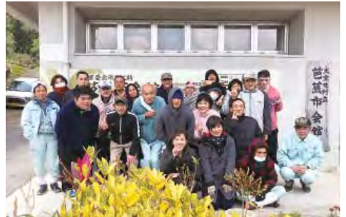
勉強になりました