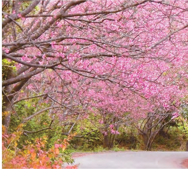
見事な押川の桜並木