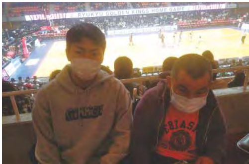
プロのスピードにびっくり！

会場の演出や音楽を用いた 応援、ハーフタイムにはイベ ント等があり、会場に足を運 ばないと感じる事の出来ない 経験でした。本人からも「楽 しました。」 以前の計画をしていました がインフルエンザの流行等が あり、計画実行が難しい状態 であったが、インフルエンザ 対策をしながら試合観戦をし ました。 平成三十年二月三日に、外 出支援として琉球ゴールデン キングスの試合観戦に出かけ ました。