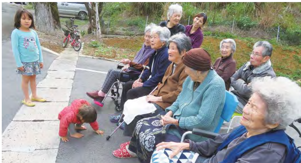
グランドゴルフの応援

一月二十八日(日) 旧喜如嘉小学校にて伝統ある行事(観桜会)(グランドゴルフや食事と花見)が開催されました。今回はグランドゴルフの見学のみとなりましたが温かく受け入れてくださり、地域の方々や子供達と触れ合うことが出来ました。 又、日頃触れ合う場が無い田嘉里区の方々とも交流する事が出来、利用者の方も喜んでいました。 来年は、見学だけでなくグランドゴルフや食事会・花見へ参加出来る様に目標を立てたいと思います。地域の方々の温かい受け入れ日々、感謝です。