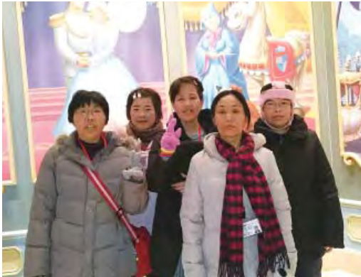
どのアトラクションも楽しかったです