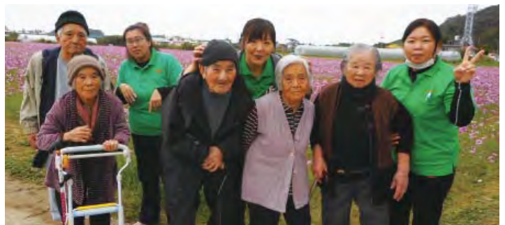
見渡すかぎりのコスモスの花に感激！