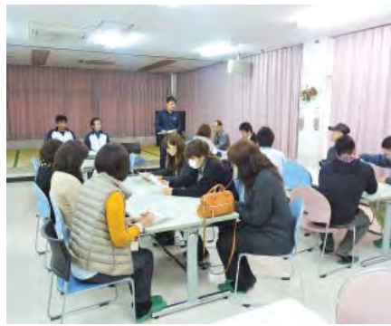
活発な意見交換ができました