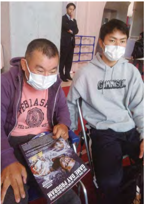
自分の目で見るのが一番

会場の演出や音楽を用いた 応援、ハーフタイムにはイベ ント等があり、会場に足を運 ばないと感じる事の出来ない 経験でした。本人からも「楽 しました。」 以前の計画をしていました がインフルエンザの流行等が あり、計画実行が難しい状態 であったが、インフルエンザ 対策をしながら試合観戦をし ました。 平成三十年二月三日に、外 出支援として琉球ゴールデン キングスの試合観戦に出かけ ました。