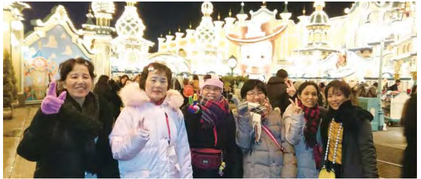
イルミネーションも綺麗でした