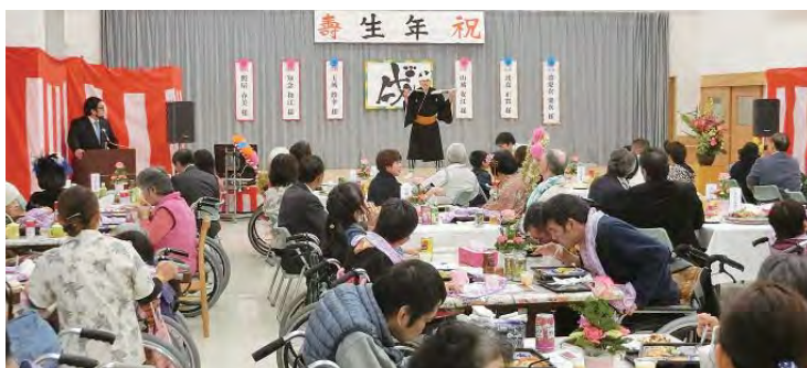
料理もおいしかったです