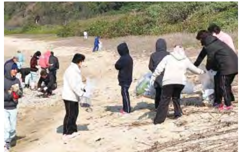
綺麗になりました

就労センターえすの里で実施している「わくわくプロジェクト」。今回のテーマは「地域を知る・地域貢献」として、国の重要無形文化財に指定されている「芭蕉布」について学ぶ為、喜如嘉にある芭蕉布会館を見学しました。原料や工程をビデオで視聴後に、伝統の技を実際に見学して地域にある伝統を知る事が出来ました。見学後は喜如嘉の海岸清掃を行い、沢山のゴミを拾って綺麗にできました。