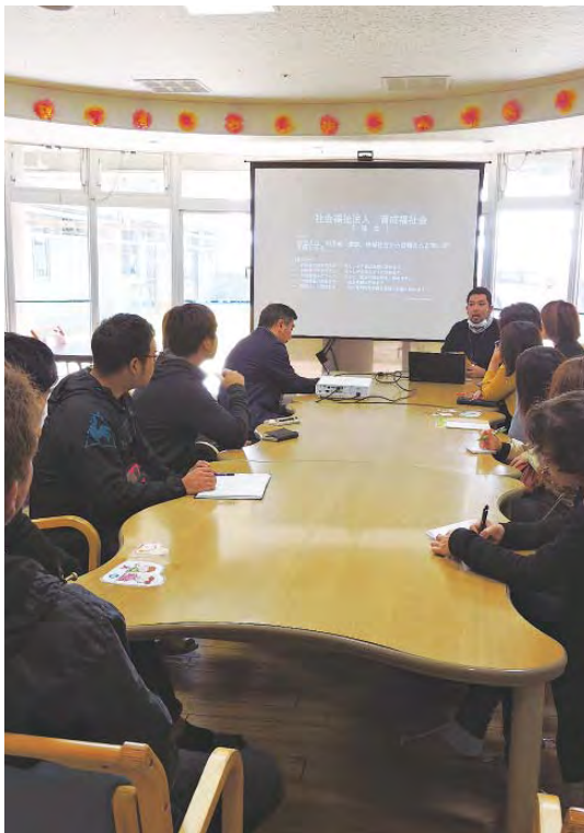
事業所の説明にメモをとる様子

えすの里では、県内の障害者支援施設等への視察研修を今年度の事業計画の大きな柱の一つとして取り組んでおり、中・南部地域の施設系や就労系の事業所のご理解とご協力を得て実施することができました。 夕食を兼ねての懇親会でも、視察先の事業所での取り組み等について参考になった事などが話題の中心となり、実になる研修会となりました。 業務多忙の中、今回の私共の取り組みに対して快く引き受けて下さいました県内の各事業所の施設長様初め職員の皆様へ感謝申し上げます。