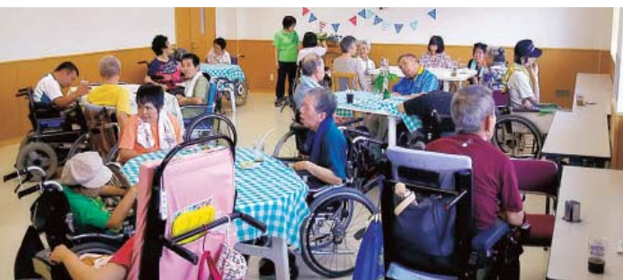
おいしいコーヒーで会話ははずむ

出張売店では、お菓子だけでなく、日用品、オーダーメイドも心良く受けて頂き、規制品では難しい物、今回仕上がった帽子ですが、色、柄も利用者さん本人は大満足で、職員共に、色々な作品を拝見し、購入出来る事でワクワクしている状況です。