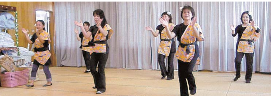
なじみの踊りで舞台を盛り上げます

過ごせたとおもいます。また、皆さん、顔見知りという事もあり、久しぶりに会ったりした様で、ユンタクに花が咲いたようでした。