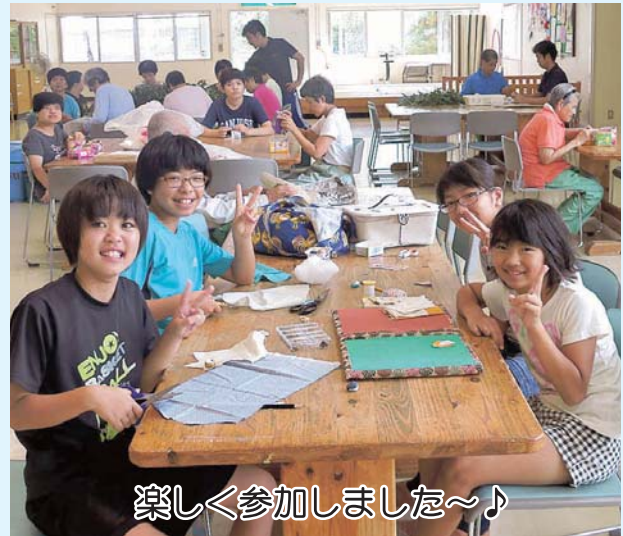
楽しく参加しました~♪