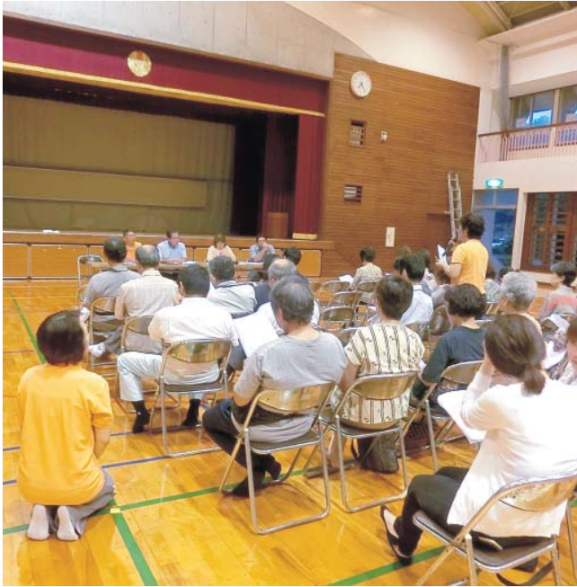
地域の方からも期待されている事を感じました。