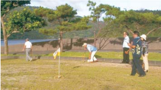
チーム1位を目指して