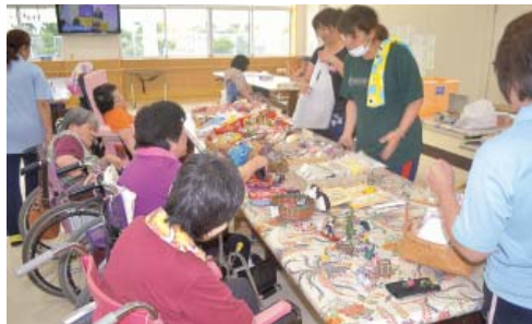
どれにしようかな～

これまで一心療護園では、互助会売店を余暇委員の方が行っていました。五月より、えすの里の協力により出張売店を始めました。