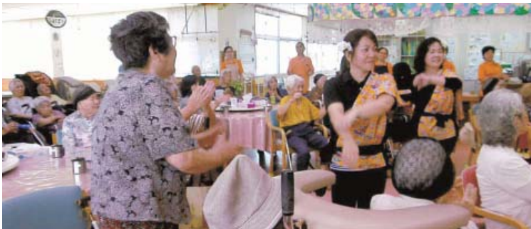
一緒になって楽しく踊りました

三十分という短い時間でしたが、五曲の踊りを踊っていただきました。ズンドコ節をはじめ、肝がなさ節など、利用者も一緒になって踊れる曲もあり、とても楽しい時間がありました。