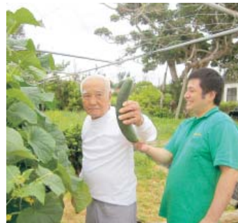
立派なキュウリが取れました

利用者のほとんどの方が野菜作りの経験者で、きゅうりや、ゴーヤーの育て方を指導していただきました。