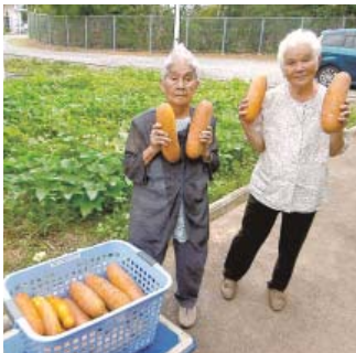
おいしそうなウリ、ウリ