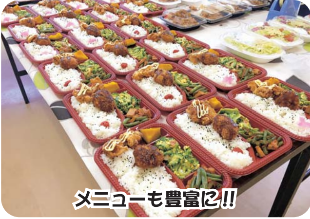
メニューも豊富に!!