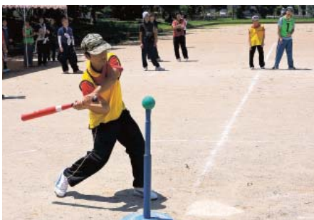
遠くまで飛んでいけ～

今年も、球技大会の季節がやって来ました。グラウンドゴルフは三連覇を、テニールは初優勝を目指してそれぞれ、クラブ活動や作業後の練習を頑張り当日を迎えました。