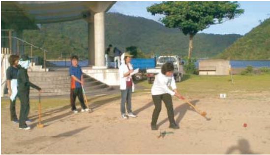
今日は調子がいいね～