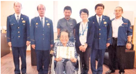
沖縄署にて表彰されました

あるとき港に密輸船が入って来て船員を駐在所で確保しました。当時の駐在所は電話が無く、夫は名護署に連絡する為に近くの酒屋まで電話を借りに行きました。夫の言い