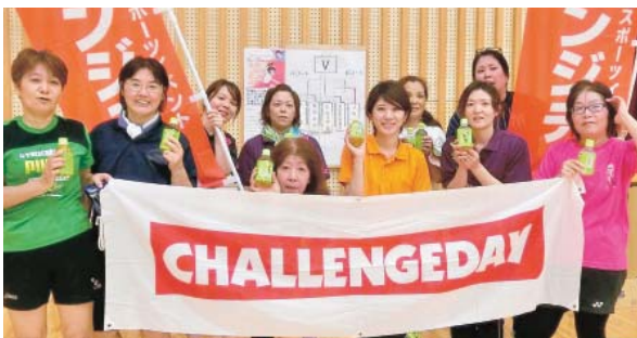
チームワークで勝利

五月二十五日(水)に大宜味村婦人会主催で大宜味小・中学校体育館でチャレンジデー関連の『炎のソフトボール大会』が行われました。一心福祉会で参加を呼び掛けたところ十数名の精鋭が集まり参加しました。