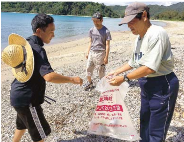
旧大宜味中学校前のゴミ拾いの様子

今夏も暑さ対策を万全にウォーキングしながら地域の美化活動も楽しみながら取り組んで行きたいと思えます。