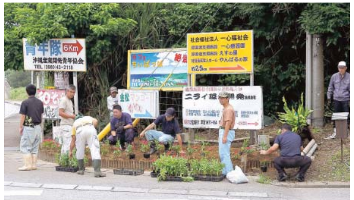
花の植え付け作業の様子