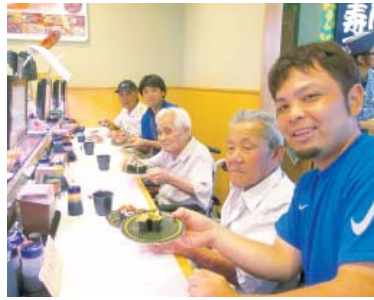
「沢山頂きました。ウマカツタ」

お腹も満たされ買物の場所は、ジャスコ内のダイソーと計画していたがあいにくの雨により、屋根付きの駐車場で車を止めて直ぐにお店に入れるということでもう又サンエーの百円ショップに変更となった。あらかじめ買うものをリストアップしていた為、スムーズに買物を終え、少し時間があまったのでサンエー内を見学、最新の掃除機に「何かこれ？」と不思議そうに見入っていて、マッサージ機の体験もしてとても満足そうな皆さんでした。