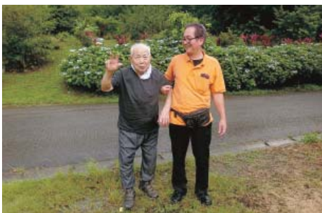
少し雨が上がったので…